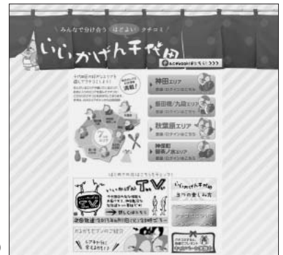
「いいかげん千代田」トップページ

またフェイスブックページでは、ホームページと同じカルガモたちが区内のイベントをいろいろご紹介しています。