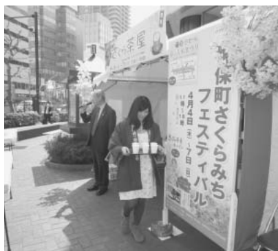
甘酒がふるまわれたさくら茶屋

神保町古書店街をあげて、恒例・春の廉価古本ワゴンセールを開催。古書店だけでなく新刊書店、小物店も出店いたしました。岩波広場に休憩所「さくら茶屋」がオープンし、無料で暖かい甘酒がふるまわれました。