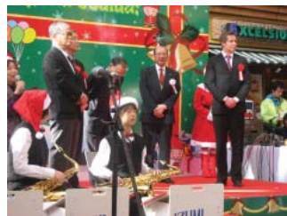
茗溪通り会 サンタクロース

流すことなく、歩道上で来街者を見守っていました。また、近くの小川広場では子供達が雪で造った滑り台やかまくらの中で楽しそうに遊んでいました。