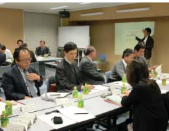
情報発信ツール検討会

千代田区商店街振興組合連合会では、かねてから、地域情報を含めた個店をアピールするための情報発信ツールの研究を進めてきましたが、このたび、区振連理事会において、正式に検討会を発足させることになりました。参加メンバーは商店の関係者、また行政側からも広く募りました。そして、第1回「地域の情報とポイントシステム検討会」を24名の方が出席し、神田公園出張所で開催しました。ポイントシステムの活用状況、地域情報と個店のポイントシステムとの融合、目指すポイントシステムとは、など活発な議論がなされました。今後6月まで毎月検討会を開く予定です。