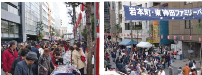
賑わう29日の岩本町ファミリーバザール

多くの人出で賑わった岩本町ファミリーバザール 平成21年11月27日～29日、12月4日～6日に柳原通りで岩本町・東神田ファミリーバザールが開催されました。前半は好天に恵まれ、多くの人出で大変な賑わいとなりました。