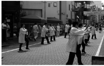
〈ふれあい感謝まつり〉