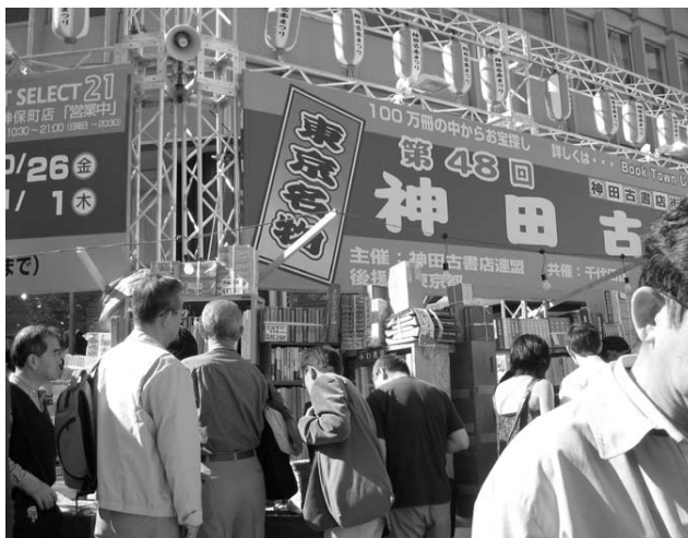
〈多くのファンで賑わう掘り出し市〉

れてひと休みする方が見られ、特にたまねぎの詰めほうだいには、家族で挑戦して楽しむ姿が見られました。