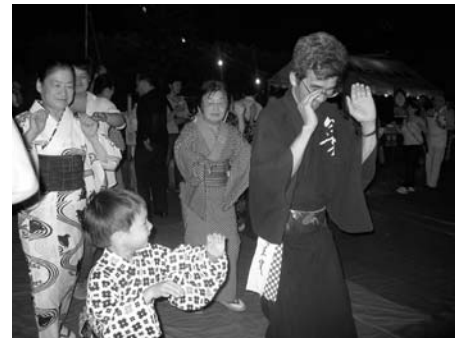
〈昔とったキネヅカ〉

オープニングセレモニーが行われ、年に一度のスポーツ祭りにこれから本番を迎えるウイメンズセンタースポーツ用品を求めらるお客様で賑わいました。