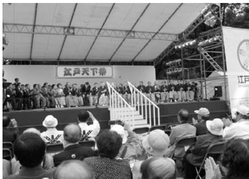
〈天下まつり開会式〉