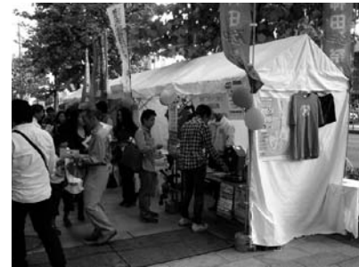
〈来場者で賑わう会場〉