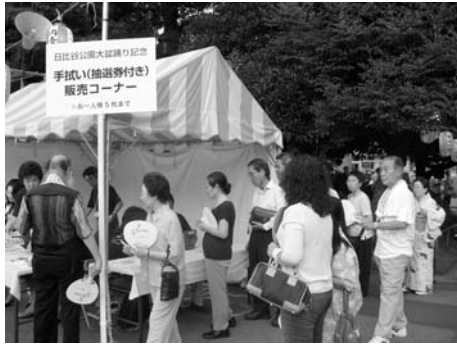
〈会場に集まる人、人、人〉

がりを演出しました。なお、区商連が初めてブースを設け婦恋村特産の野菜、「田口文銭堂」「淡平」「萬屋」各店のご協力を得て、お菓子やビールなどを販売しました。ブース前には行列ができ、各商品を殆ど完売することができました。