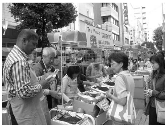
〈紅茶の香りに誘われホットひといき〉