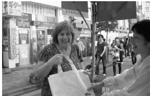
〈エコバックを求める外国人来場者〉

いましました。また、アート作品の掘り出し市では、陶器やアクセサリ、絵画に加えてTシャツ、ケーキが並べられ、区商連でも「エコバック」を販売しました。 さらに、和泉小学校の生徒達によるジャズバンドの演奏、街なみウォーク、学生が描く、店長似顔絵コンテストなど、盛り沢山の催し物に皆さん楽