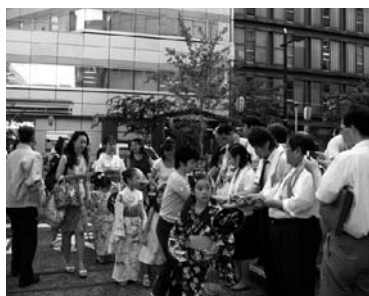
〈多くの来場者で賑わう会場〉

八月三日・四日に日本テレビ駐車場を会場に開催されました。台風の影響がありましたので、設営の一部が変更され、浴衣姿の子どもや多くの皆さんが参加されました。特設槽では歌や演奏もあり、真夏の夜を楽しんでおられました。