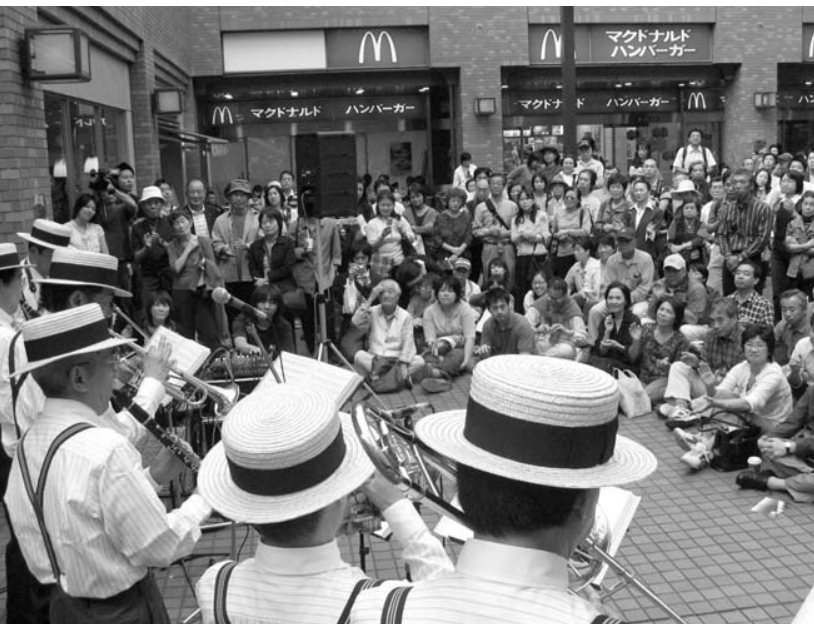
〈ジャズ演奏と来場の皆さん〉

いましました。また、アート作品の掘り出し市では、陶器やアクセサリ、絵画に加えてTシャツ、ケーキが並べられ、区商連でも「エコバック」を販売しました。 さらに、和泉小学校の生徒達によるジャズバンドの演奏、街なみウォーク、学生が描く、店長似顔絵コンテストなど、盛り沢山の催し物に皆さん楽