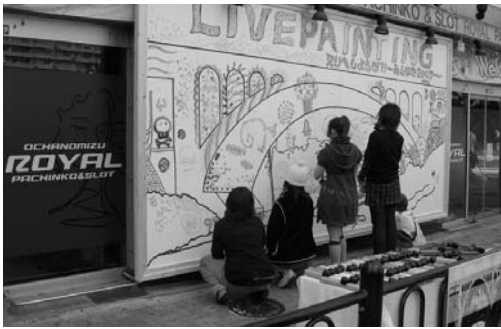
〈熱心に見入るギャラリー〉

多くの方が参加して、ニコライ堂や聖橋など御茶ノ水界隈の名所・旧跡に、絵筆をほしらせ、プロも顔負けの素晴らしい絵を描き、合評会を開いてそれぞれの感想をのべて