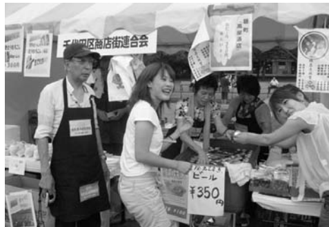
〈来店者で賑わう区商連ブース〉

がりを演出しました。なお、区商連が初めてブースを設け婦恋村特産の野菜、「田口文銭堂」「淡平」「萬屋」各店のご協力を得て、お菓子やビールなどを販売しました。ブース前には行列ができ、各商品を殆ど完売することができました。