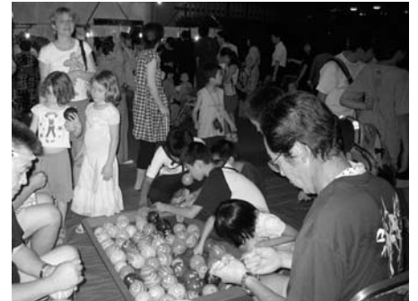
〈こどもも楽しむヨーヨー祭り〉