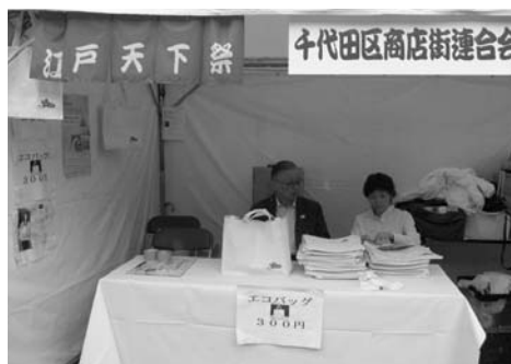
〈区商連エコバックを配布〉