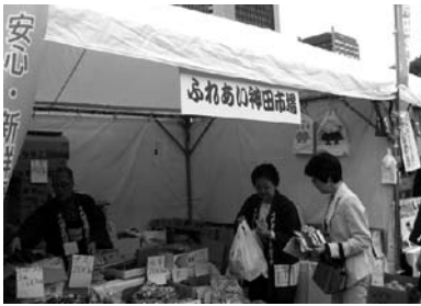
〈新鮮野菜のセール〉

八月一日から商品購入の際スタンプを集め、豪華商品が当たるスタンプラリーのスタート、二十七日から五日間、ふれあい神田市場での新鮮野菜のセールなど、さらに二十七日午前十一時三十分から午後一時まで車両制限をして大江戸浮世絵節、IZANAIよさこい踊りで盛り上がりました。