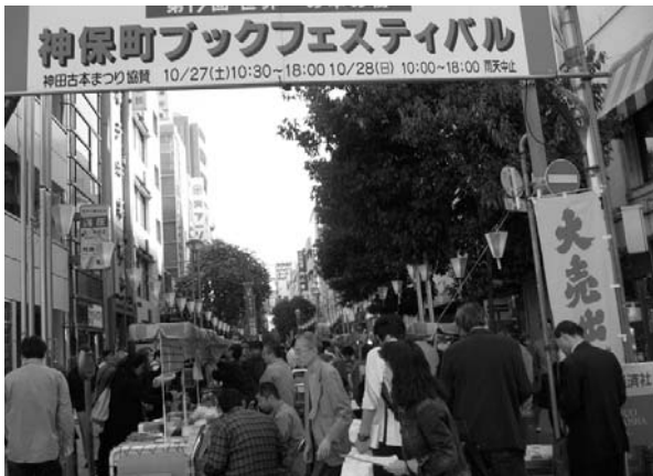
〈賑わうメイン会場(すずらん通り)〉

さらに会場に北海道美瑛町の特産のじゃがいもやたまねぎの販売、飲物のブースもあり、紅茶の香りに誘わ