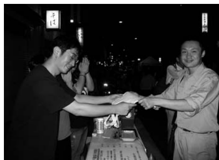
〈抽選会に提供された「エコバック」〉

露して会場に華を添えました。同じく十月六日には神田西口商店街を会場に、秋田地方の物産品や、神田ふれあい商店会の婦恋村特産野菜の販売があり、併せてこれからの神田を考える「スローフードとまちの未来シンポジウム」が開かれ、盛況の中に終了しました。