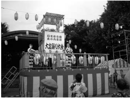
〈特設やぐらから開演あいさつ〉

物客を集め盛大に開催されました。午後六時の開始から主催関係者の挨拶があり、イギリス大使館職員による太鼓の撥さばきを合図に、千代田・中央・港・新宿区の民踊連による浴衣姿も美しいしなやかな踊りに、家族連れや勤め帰りの人たちも加わり、一層の盛りあ