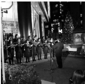
<共立女子高校生によるクリスマスキャロルのタペ>