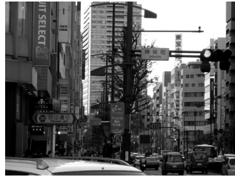
＜フラッグが掲出された靖国通り＞

九段商店街振興組合・靖国通り商店街連合会・麹町通り商店会は十一月から十二月まで「オリンピック招致フラッグ」を商店街に掲出し、招致気運の盛り上げに協力しました。