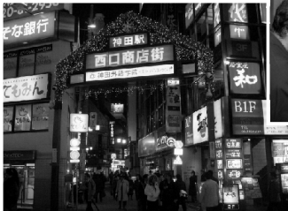
<イルミネーションに多くの人で賑う>