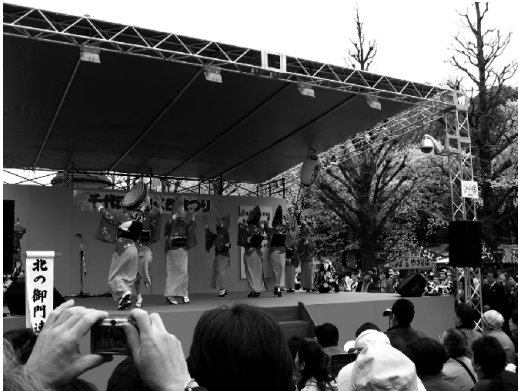
＜富士見地区北の御門連の踊り(昨年のフェスティバルより)＞

恒例の「さくらフェスティバル」が三月二十八日(金)から三月三十日(日)に開催されます。