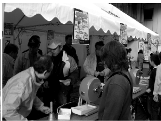
<来客で賑わう謝恩セール>