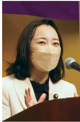
参議院議員 吉良 よし子 様