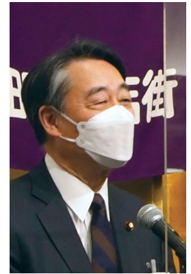
衆議院議員 海江田 万里 様