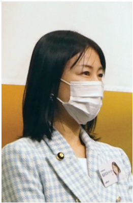
参議院議員 塩村 あやか様