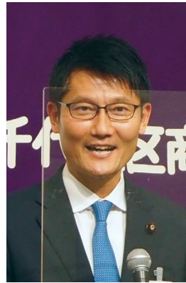
参議院議員 朝日 けんたろう 様