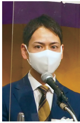
東京都議会議員 平 けいしょう 様