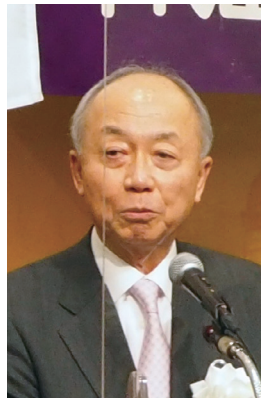
千代田区議会議長 桜井 ただし 様