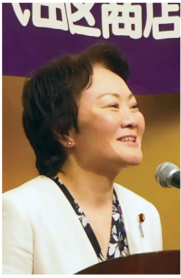
衆議院議員 山田 美樹 様