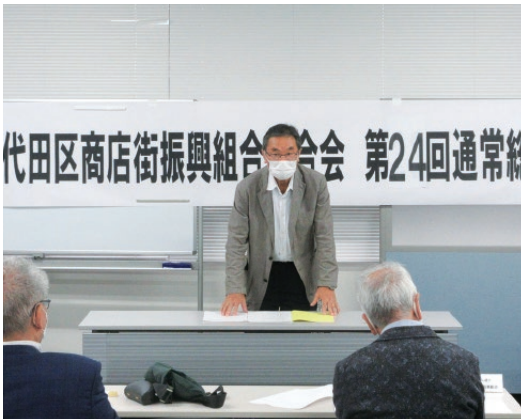
千代田区商店街振興組合連合会

「東京で一番に安全でそして安心してお買物が出来る商店街」次に「お客様が楽しくお店の方とお話しをしながらお買物が出来る商店街」最後に「賑やかで活気に溢れた元気な商店街」を目指して取り組んでいくことを目標として参りました。今後も商店街連合会とも歩調を合わせて三つの目標に向かって邁進していきます。