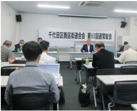
千代田区商店街連合会

令和5年6月27日（火）に千代田プラットフォームスクウェア4階会議室にて14時から千代田区商店街連合会、15時から千代田区商店街振興組合連合会の通常総会が開催され、各々すべての議案が満場一致で承認されました。